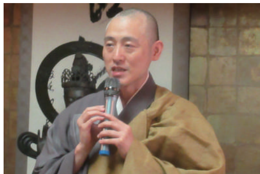
日本曹洞宗について説明される砂越ご住職