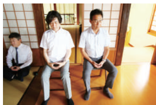
無我の境地?の二人