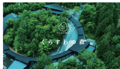
くらすわの森・・・東京ドーム 3.3 個分

また2024/10/3にグランドオープンした【くらすわの森】についてご説明頂きました。以下にいくつか写真を載せておきます。興味深い話が多く、皆さんも聞き入っていられた方が多くいらっしゃいました。