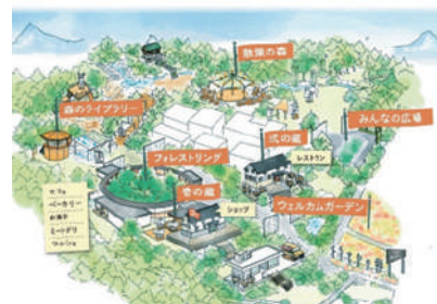
全敷地面積・・・東京ドーム 4.7 個分